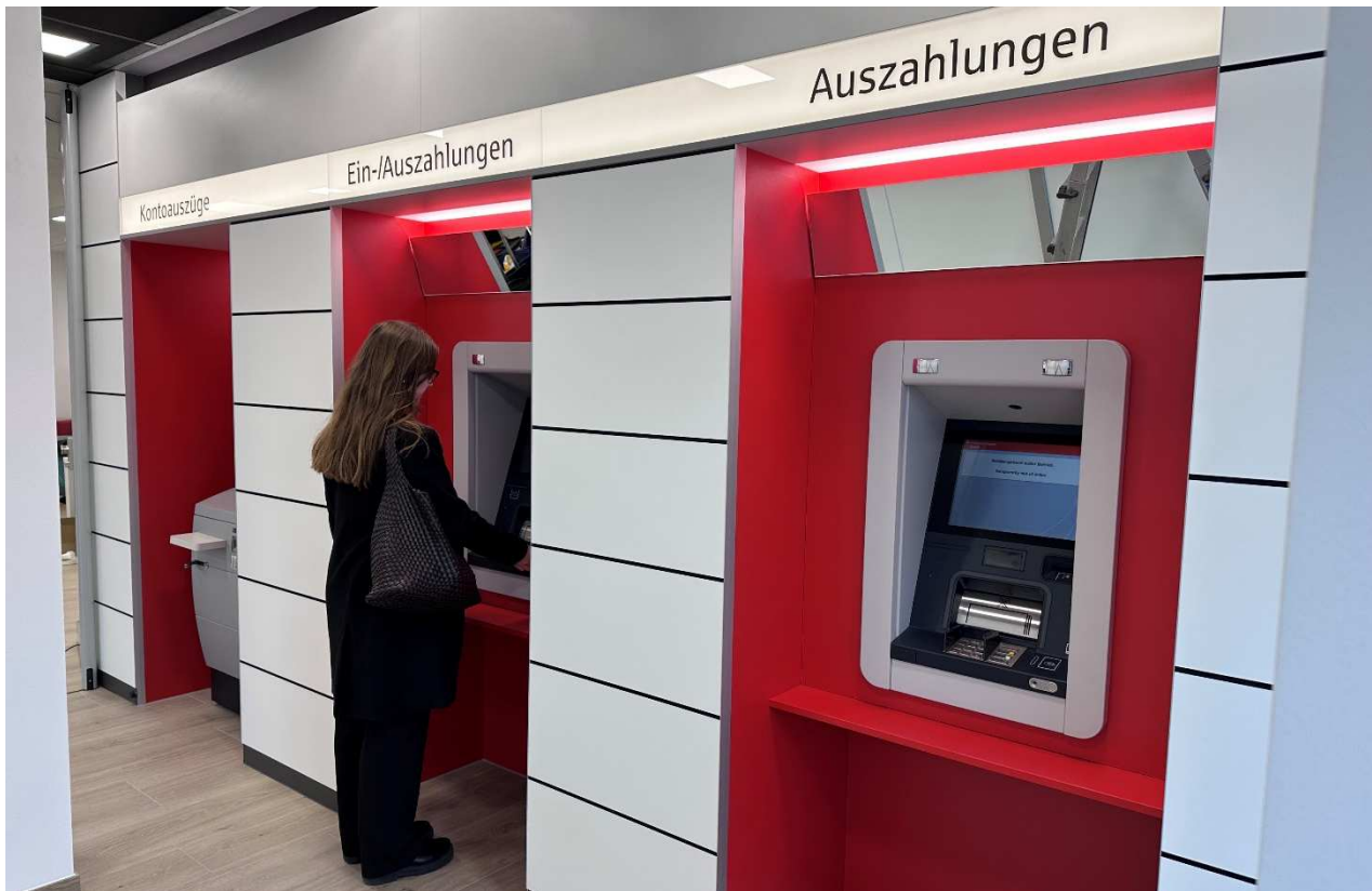
Großzügiger und gut ausgestatteter SB-Bereich mit zwei Geldautomaten, davon einer mit Ein- und Auszahlungsfunktion und einem Kontoauszugsdrucker