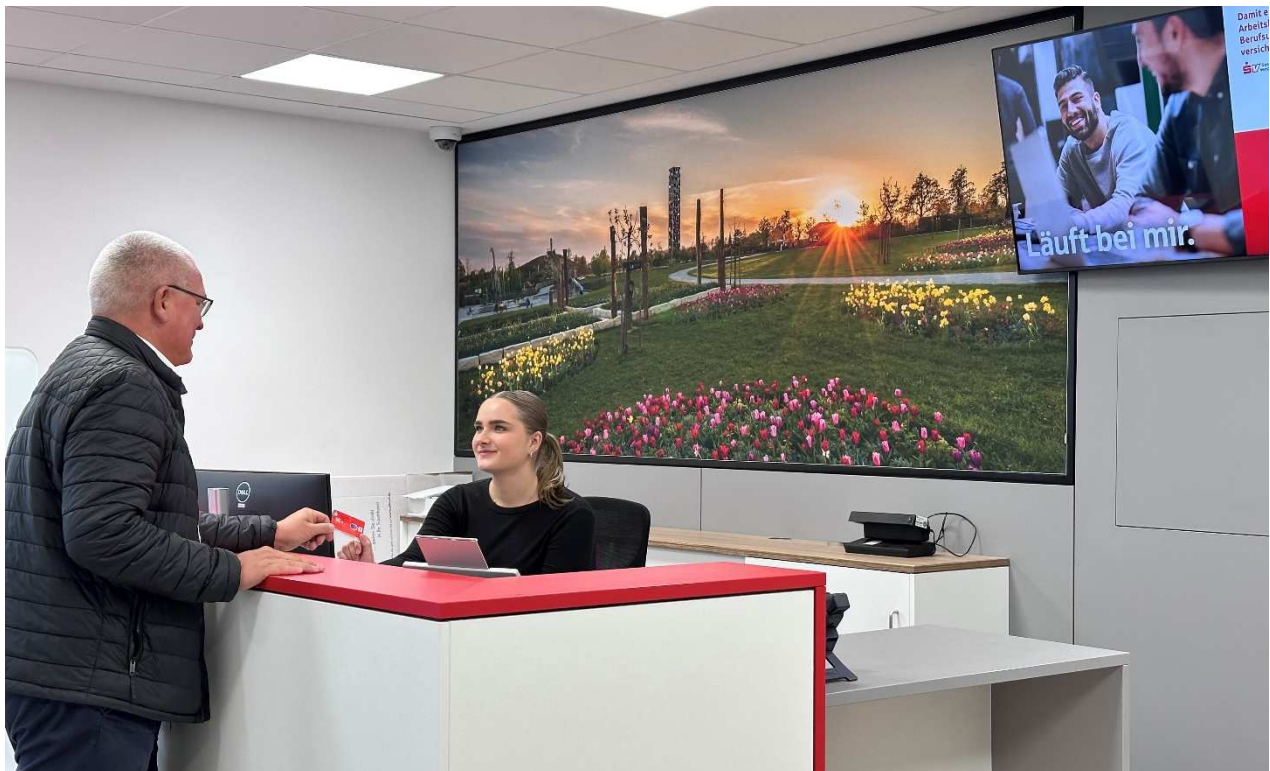
Persönlicher Kundenservice an der offen und dialogfreundlich gestalteten Servicetheke

Der helle und freundliche Service- und Selbstbedienungsbereich ist vollständig barrierefrei und verfügt über eine attraktive Theke, die auch für Rollstuhlfahrer optimal geeignet ist. Der SB-Bereich ist von 6 bis 23 Uhr zugänglich und bietet zwei moderne Geldautomaten, einer davon mit Ein- und Auszahlungsfunktion, sowie einen Kontoauszugsdrucker. In den drei diskreten Beratungszimmern wird hochqualifizierte und individuelle Beratung in Verbindung mit modernsten digitalen Möglichkeiten erlebbar.